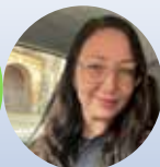
Nicoline M. Olden-Jørgensen (layout)